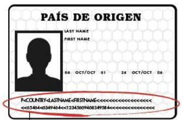
ZONA DE LECTURA MECÁNICA

Un viajero VWP con un pasaporte válido y legible mecánicamente sin una fotografía digital no necesita un nuevo pasaporte electrónico hasta la caducidad del existente, siempre que dicho pasaporte legible mecánicamente haya sido emitido antes del 26 de octubre de 2005.